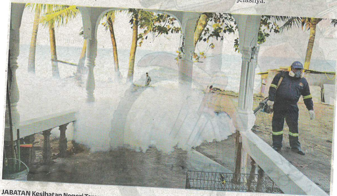
JABATAN Kesihatan Negeri Terengganu telah melakukan semburan kabus di 119,032 premis di seluruh negeri berkenaan sejak awal tahun ini. – GAMBAR HIASAN

“Saya menyeru penduduk setempat agar meluangkan masa 10 minit setiap minggu untuk mencari dan memusnahkan tempat pembiakan nyamuk aedes di sekitar rumah mereka,” jelasnya.