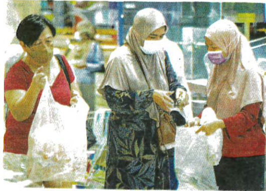
ORANG ramai dilihat masih memakai pelutip muka ketika tinjauan di sebuah pasar raya di Subang Jaya semalam.

Menurutnya, ramai yang beranggapan negara sudah memasuki fasa endemik dan tidak perlu lagi memakai pelutip muka